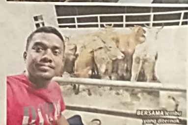
BERSAMA lembu yang diternak