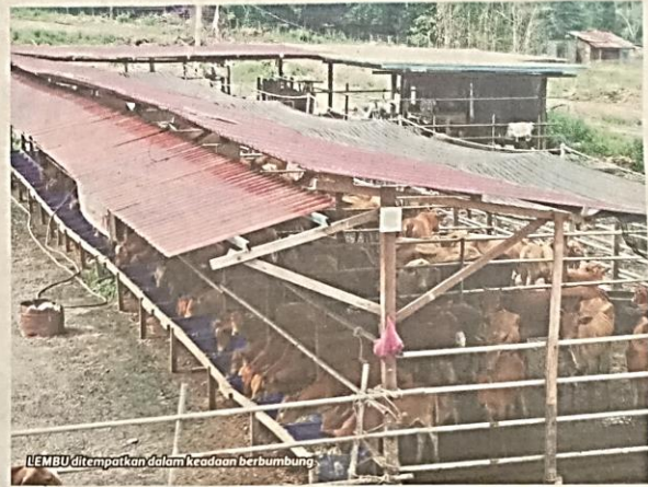
LEMBU ditempatkan dalam keadaan berbumbung

Kadangkala I embu yang dibeli daripada pembeli sebelum ini mungkin agak kurus dan memerlukan makanan yang lebih bagi memastikan ia berisi MOHD FAIZAL